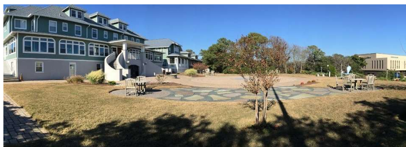
La sede dell’A.R.E. a Virginia Beach, Virginia

“La reincarnazione di personaggi biblici: Andrea l’Apostolo” in LA NOSTRA SPIRITUALITA’ - Reincarnazione