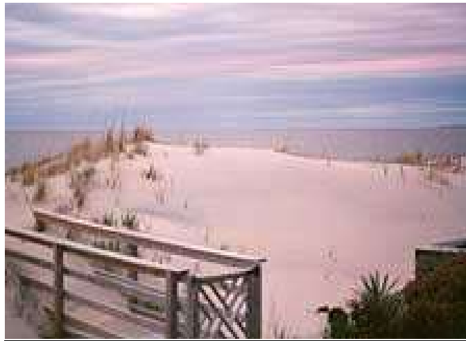
La sede dell'A.R.E. a Virginia Beach: vista sull'oceano

Chi è interessato a creare un centro olistico di Cayce scriva a: areitaly@libero.it